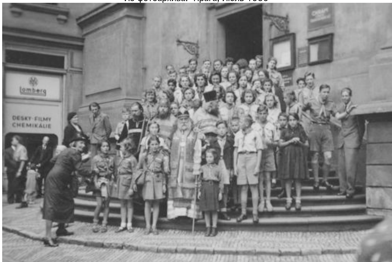
Отъезд в лагерь (перед русским храмом)