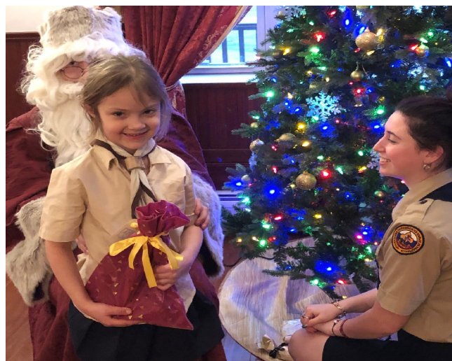
Елка дружины Царское Село