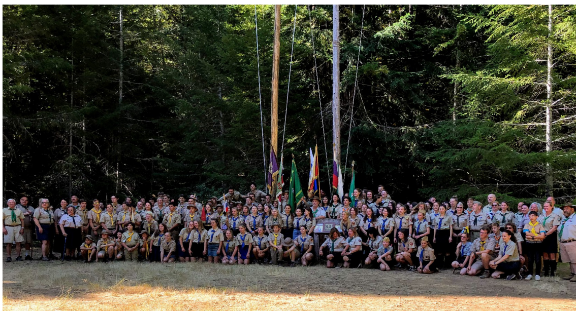
Слеты 2019 – Подробности в следующем номере Вестника