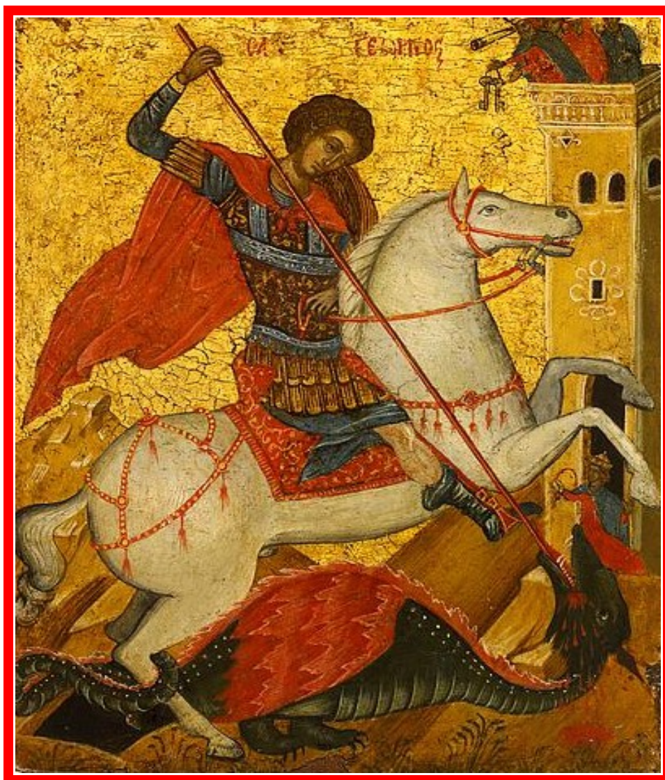
Великомученик Георгий Победоносец