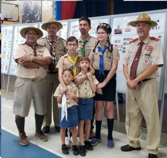
Скаутская выставка в Панаме (см. стр. 9)