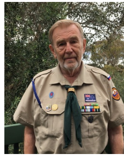
скм. А. Ильин