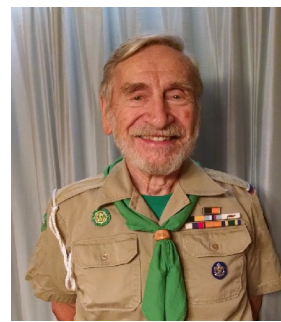
скм. А. Таурке