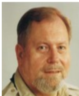
скм. М. Данилевский