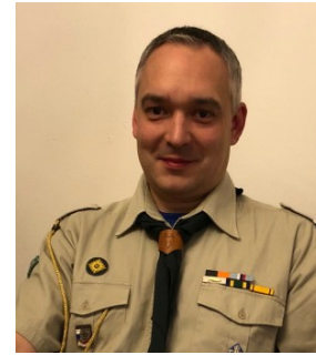
скм. Г. Кобро