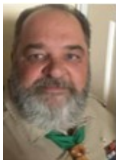
скм. М. Данич