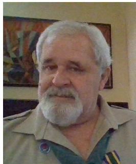
скм. П. Козин