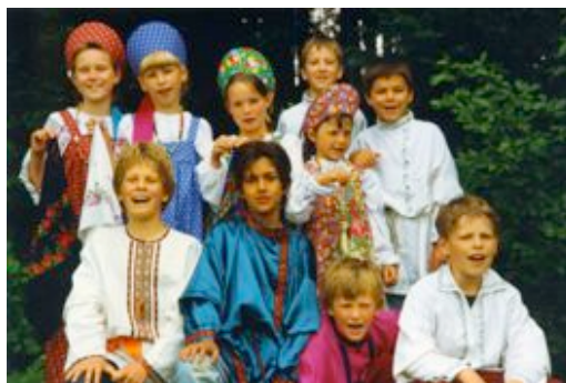
Цикловая игра «Обитатели града Китежа»