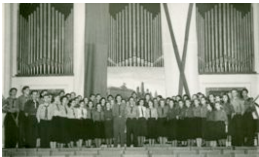
Дружина русской гимназии на сцене мюнхенского «Софиензааль» в 1949 году во время постановки «Трагедия России».