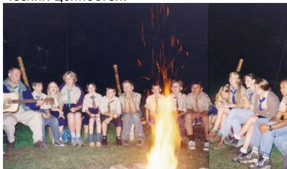
«Романтика костров ...»

Кроме всего этого, сама жизнь в спартанских условиях лагерей, дисциплина и четкая программа дня, помогает закалке и выносливости, вырабатывает сноровку, подтянутость, наблюдательность и находчивость. Обычно дети, попав первый раз в лагерь, сразу привыкают ко всем неудобствам и трудностям, и быстро усваивают, что можно оказывается без всякого излишнего комфорта, без компьютеров и телевидения, среди природы, весело, увлекательно и полезно провести время, а дружеская атмосфера лагеря, торжественные церемонии, церковные службы, беседы и дискуссии у костра способствуют пониманию нравственных, национальных, религиозных и общечеловеческих ценностей.