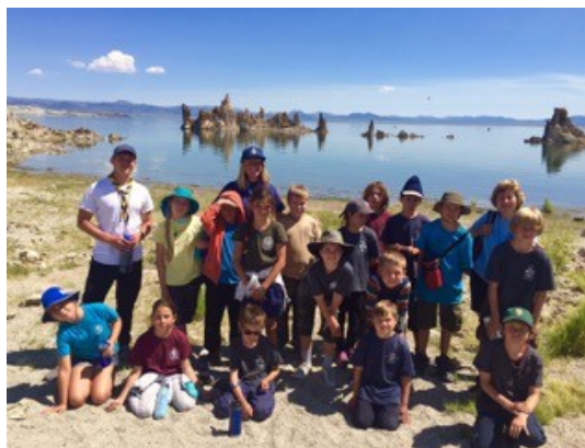
Белочки и волчата на берегу озера Моно.

разведчества: на вторые выходные – мы отправились кататься на лыжах и сноубордах. На Мамонтовой горе лыжные трассы бывают открыты весь июнь–июль. В этом же году навалило столько снега, что не только трассы, но и все тропы сверху донизу были под снегом. Разведчики и разведчицы катались в майках и шортах, мы же – руководители в полной форме!