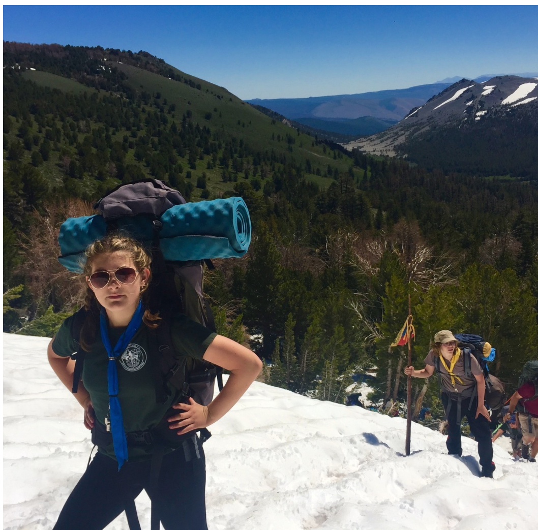
Летний лагерь — в снегу (см. стр. 2)