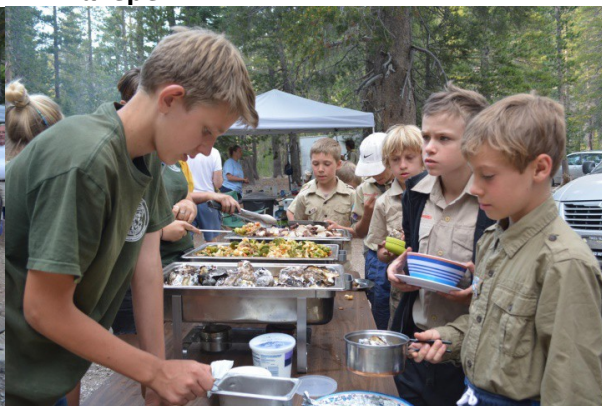
Дежурные на кухне раздают обед