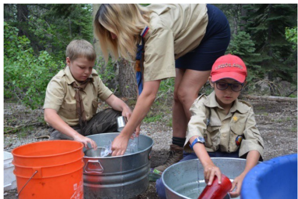
А есть специальность на посудомойца?