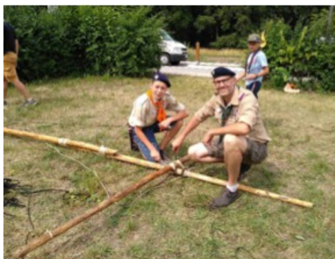
Мачта срублена - лагерь окончен!

Краеведческий музей города Вильца разделён на отделы посвящённые средневековью, важным производствам города, Второй мировой войне и арденнской операции. Мы внимательно осмотрели экспозиции и свидетельства подпольного движения сопротивления нацистам, где можно было встретить листы с приговорами и смертными казнями. Большая часть экспозиции посвящена выдворению союзной армией американцев из арденнского региона. В музейной коллекции было уделено особенное внимание помощи американских военных в послевоенную разруху населению, жившее в острой нищете.